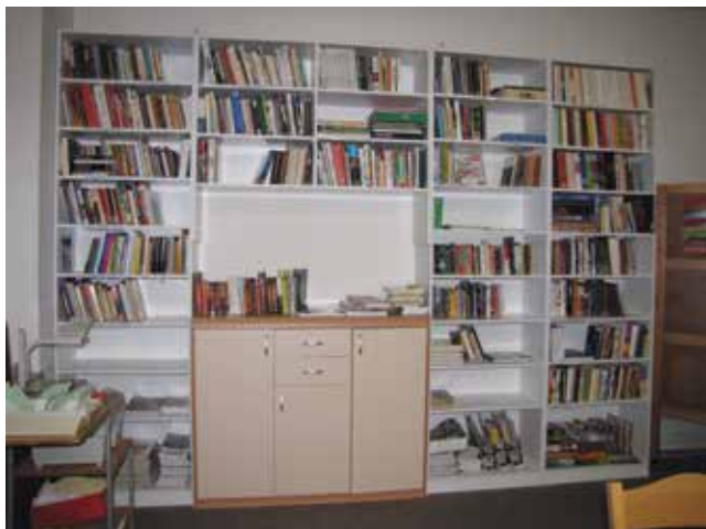
Marinkina knjižnica leta 2010

Da bi našim bralkam in bralcem olajšali dostop do najbolj iskanih knjig, smo se odločili, da bomo posegli v police s strokovno literaturo. Del strokovnih knjig smo popisali in shranili v škatle na omare ter v skladišče. Te knjige so v sistemu COBISS označene kot založene. Tako smo pridobili prostor za biografije in zgodovinske knjige, temi, ki sta med strokovno literaturo najbolj brani. Dodaten prostor nam omogoča tudi boljši pregled nad poezijo in domačo literaturo.