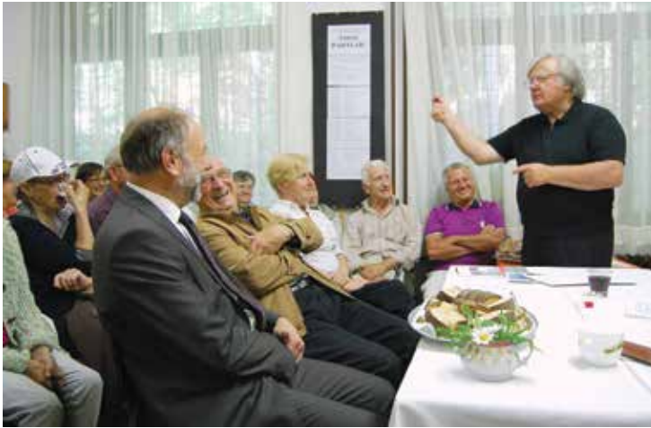
Tone Partljič pri podelitvi bralne značke leta 2012