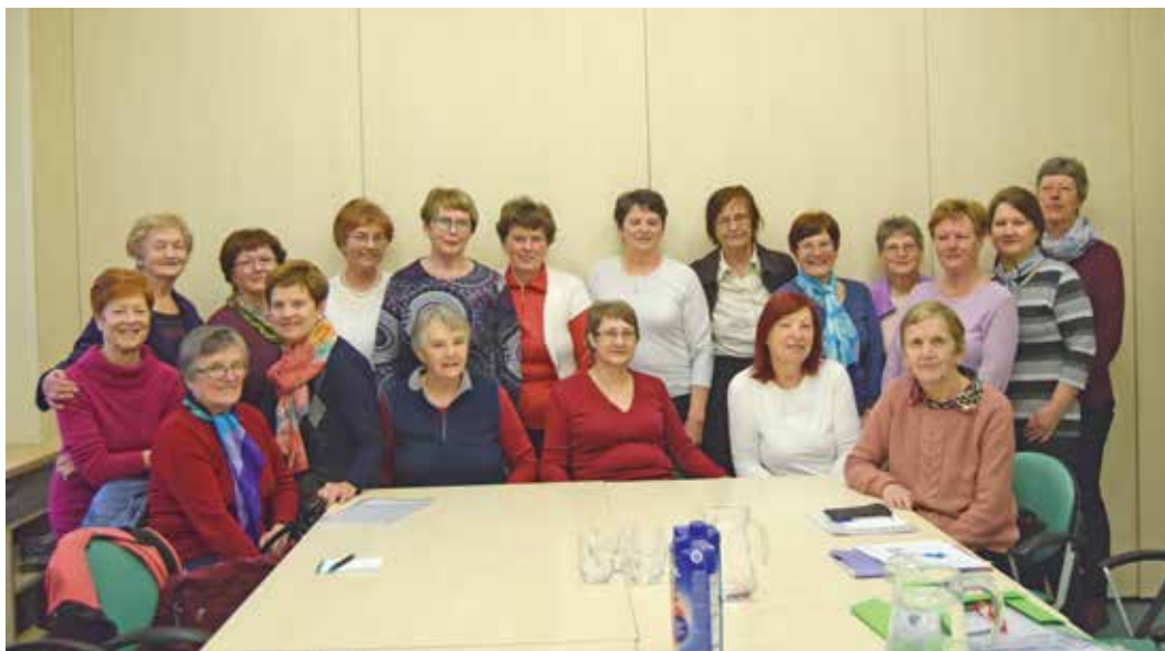
Prostovoljke programa Starejši za starejše

Program Starejši za starejše predstavlja izjemen primer dobre prakse na področju prostovoljstva, saj starejšim osebam, ki živijo v domačem okolju, omogoča bolj kakovostno in neodvisno življenje. Namen programa je spoznati kakovost življenja starejših in razviti trajno socialno mrežo, ki bi z minimalnimi sredstvi skrbela za medsebojno pomoč starejših in starejše usmerjala k osebam in ustanovam, ki jim lahko nudijo strokovno pomoč, kadar bi bilo to potrebno. Program poteka pod okriljem Zveze društev upokojencev Slovenije in ga izvaja že skoraj 300 lokalnih društev. Društvo upokojencev Škofja Loka se je v program vključilo aprila 2008. Začeli smo z idejo, da bi mlajši upokojenci pomagali starejšim vrstnikom. Naslove in podatke o starosti posameznikov nismo imeli in tako smo z delom začeli le na osnovi osebnih poznanstev. Pred štirimi leti smo se z občino Škofja Loka sporazumeli, da nam posreduje naslove vseh oseb, starejših od 69 let, program pa tudi sofinancira.