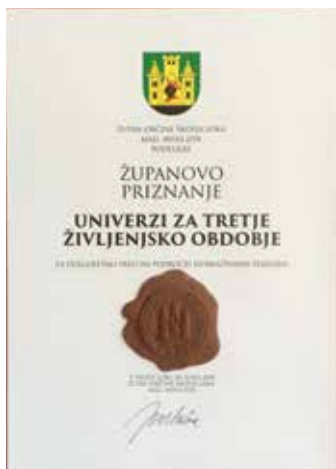
Županovo priznanje leta 2018