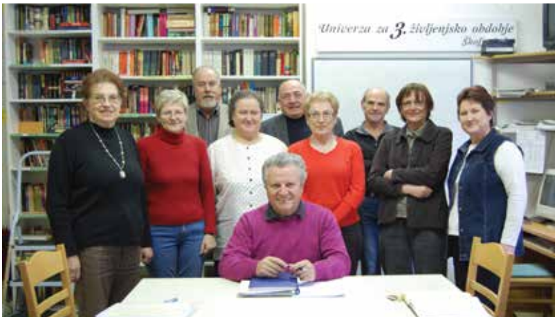
Upravni odbor DU leta 2010

► Ko sem se pomladi leta 2007 oglasil na društvu, sem imel do upokojitve še pol leta, poleg tega pa sem načrtoval še daljšo odsotnost, vendar sem na prigovarjanje moje predhodnice Mane in še zlasti tajnice društva Cvete vseeno sprejel to odgovorno funkcijo. Takrat sem poznal zelo malo članov, razen tistih, s katerimi sem sodeloval med aktivno delovno dobo in tistimi iz najbližjega okolja. Da bi se čim lažje in čim hitreje vključil v ta novi kolektiv z 2 300 člani,