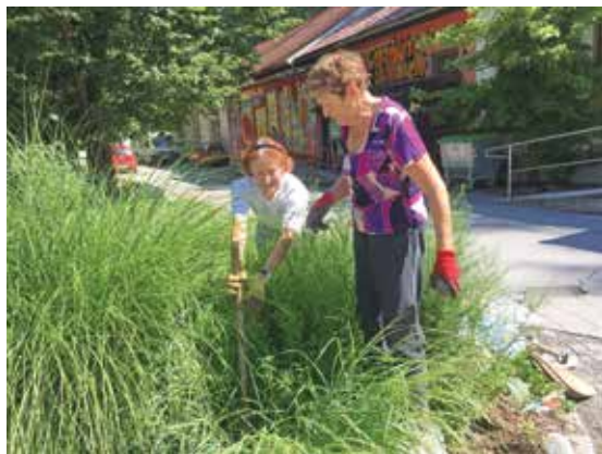
Skrb za vrtiček pred našo stavbo

Največ naših prostovoljcev po domovih naših članov in članic pobira letno članarino in raznaša glasilo Mi o sebi. Od leta 2008 precejšnji delež zavzemajo prostovoljke in prostovoljci programa Starejši za starejše. Ustvarjanje glasila Mi o sebi, ki je luč sveta ugledalo leta 2007, je razmeroma zahtevno. Amaterske dopisnice in dopisniki pod skrbnim vodstvom urednice se trudimo, da glasilo izide trikrat na leto in razveseli mnoge članice in člane v naši bližnji in daljni okolici, nekaj izvodov pa zaide tudi v tujino. Tudi v Marinkini knjižnici delajo le prostovoljke. Delo v galeriji Hodnik je zanimivo in pestro, saj bogate