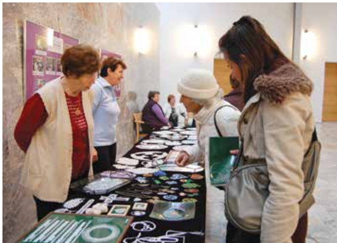
Kljeklarice razstavljajo v Sokolskem domu ob kulturnem prazniku leta 2011.