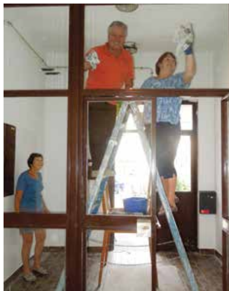
Udarniško delo v bodoči galeriji Hodnik

► Vsako leto pripravimo več samostojnih ali skupinskih razstav, ki trajajo dalj časa, posamezne dogodke, kot so zbor članov DU, dogodki Čaj ob petih, prireditve Pozdrav pomladi ali Teden vseživljenjskega učenja, pa popestrimo s spremljevalnimi razstavami. Čeprav spremljevalne razstave trajajo le nekaj ur, jih je vredno pripravljati, saj ravno z njimi prikažemo raznolikost ustvarjanja naših amaterskih in profesionalnih ustvarjalcev. Povprečno pripravimo okrog 17 razstav na leto. Nekatere razstave so postale že tradicionalne, kot sta razstava o aktivnostih društva v pretekli sezoni in fotografska razstava Moj