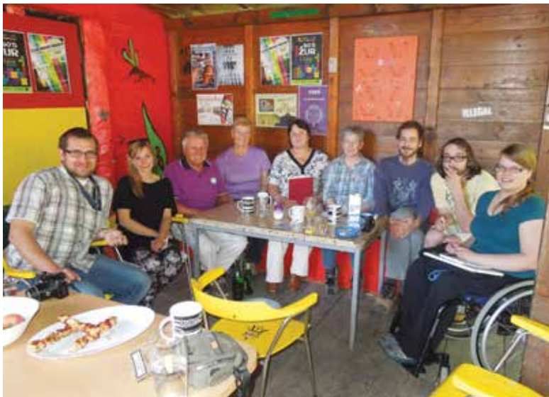
Zavod O in DU - dogovor o sodelovanju leta 2012

Vsem tem in morda še drugim neimenovanim se iskreno zahvaljujem za razumevanje, pripravljenost za sodelovanje in pomoč pri utrditvi dobrega imena našega društva v našem lepem in zdravem okolju.