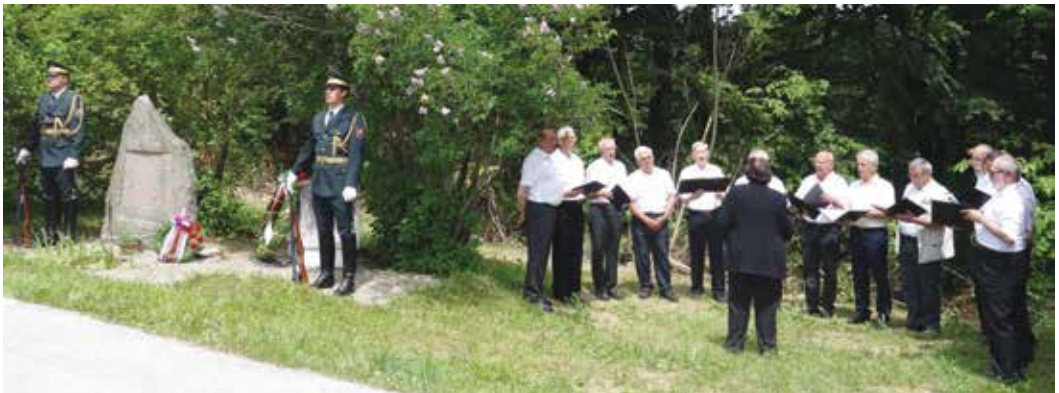
Moški sestav Vrelca na komemoraciji v Rovtu leta 2016

Leta 2010 je Vrelec praznoval 10. obletnico, ki jo je obeležil s koncertom v Sokolskem domu v Škofji Loki. Ob tem jubileju je zbor izdal tudi zgoščenko, posneto v kapeli Loškega gradu. Na reviji upokojenskih pevskih zborov Gorenjske se je uvrstil na prvo mesto in si s tem prislužil nastop na Festivalu za tretje življenjsko obdobje v Cankarjevem domu.