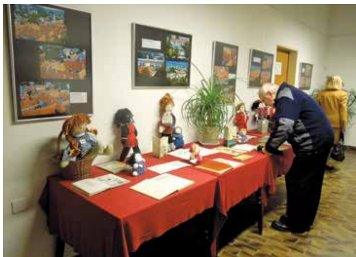
Fotografska razstava in razstava lutk v galeriji Hodnik leta 2012

Zaradi narave prostora smo prisiljeni predvsem na razstavljanje na stenah. Resnično se veselimo nove razstavne mize s stekleno površino, ki nam bo omogočila varno razstavljanje tudi izdelke in predmete, ki zahtevajo posebno predstavitev. Iskali smo tudi možnosti za postavitve naših razstav izven prostorov galerije Hodnik. Do sedaj smo gostovali v Sokolskem domu, Knjižnici Ivana Tavčarja, Osnovni šoli Škofja Loka-Mesto, Centru slepih, slabovidnih in starejših občanov, Rokodelskem centru DUO, Mali galeriji občine Škofja Loka, na Bledu in na Kokrici ter v Cankarjevem domu, kar je prav gotovo dopolnilo pestrost naših predstavitev. V osmih letih je pri nas razstavljal kar 976 razstavljalcev, za vsako razstavo pa stojijo tudi mnoge roke pridnih prostovoljcev.