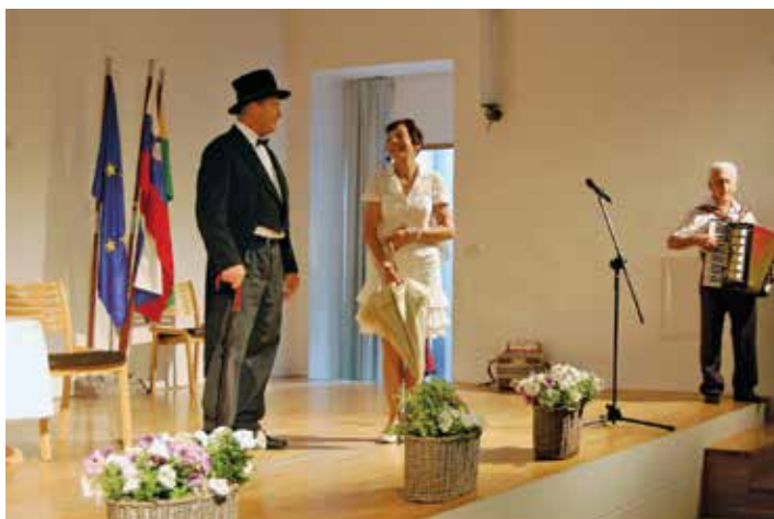
Veseli večer junija 2015 Gremo po Loki

odnose med ljudmi vseh generacij. Pridružite se nam, veseli vas bomo.