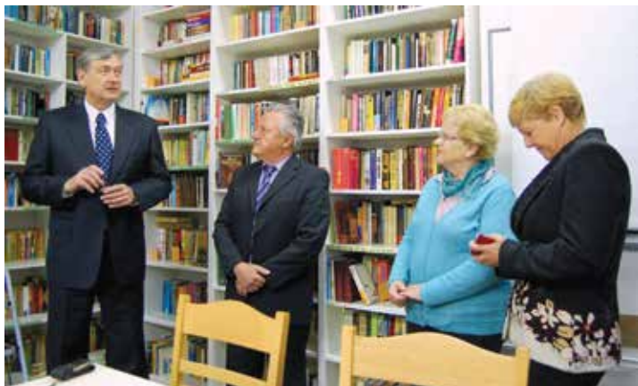
Obisk predsednika RS dr. Danila Türka aprila leta 2012

► Naše glasilo je enkratna publikacija, saj glasila v takšni obliki, takšne kakovosti in s takšno vsebino nima nobeno društvo. Koliko energije, volje