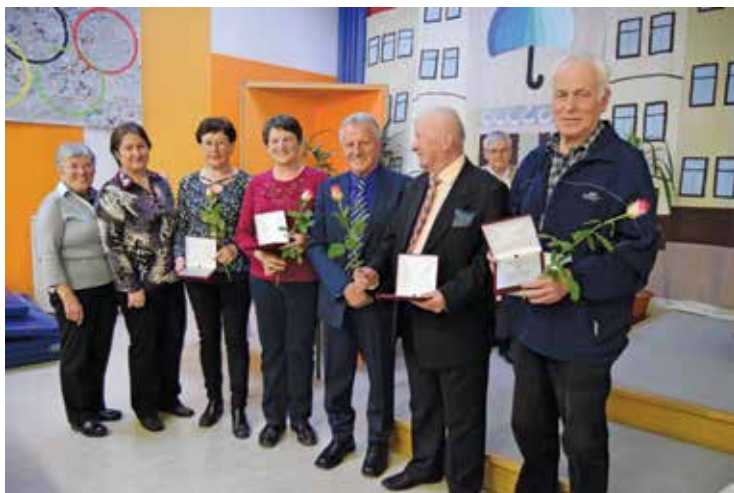
Podelitev plaket DU na letnem članskem zboru marca 2018