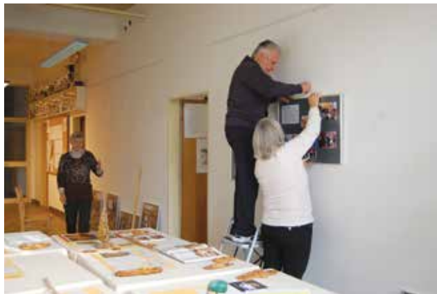
Priprava fotografske razstave

razstave polepšajo dan tako obiskovalcem kot tudi avtorjem. Na kulturnem področju delujejo še pevci MePZ Vrelec, pevska skupina Mavrica in v zadnjih letih tudi Loške orglice. Člani vseh omenjenih skupin so prostovoljci, ki nastopajo na prireditvah v okviru društva in tudi izven njega. Športnice in športniki ter njihovi vodje se ukvarjajo z mnogimi športi, pri čemer dosegajo odlične