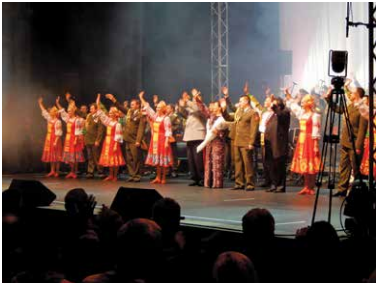
Zbor Rdeče armade v Stožicah