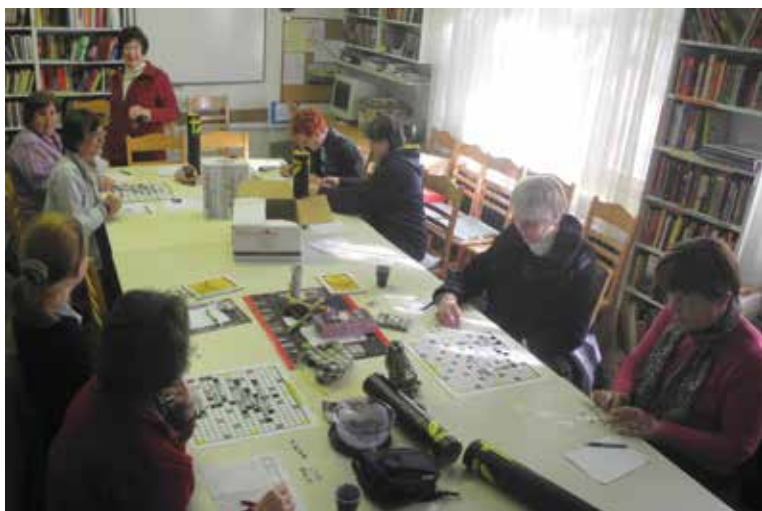
Križemkražem ob petkih v Marinkini knjižnici

Mentorica nas je poučila, da se križemkražem igra v parih. Točke igralci