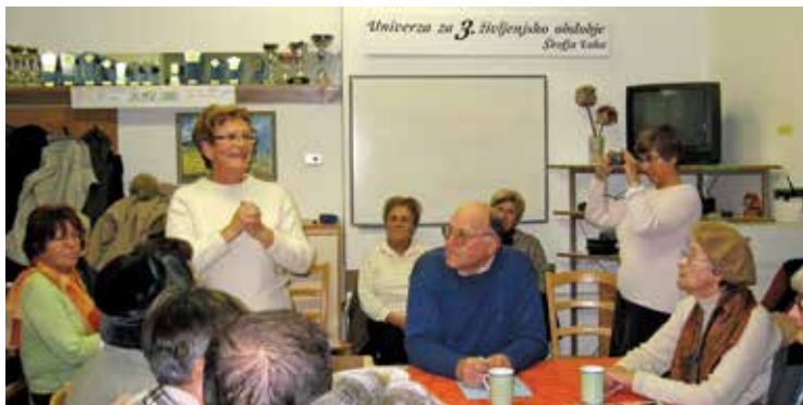
Čaj ob petih - 2007 zgodovina Škofje Loke

V teh desetih letih je univerza napredovala, saj smo vsako leto dodajali nova področja.