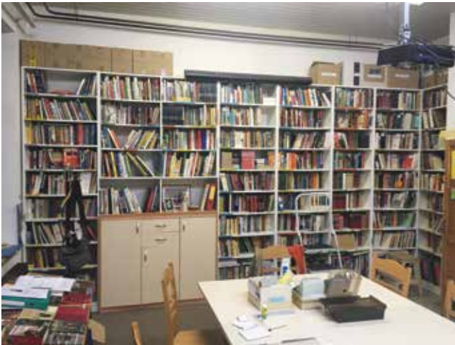
Marinkina knjižnica danes

časa. Ustreči skušamo vsem. Na mizah galerije Hodnik so razstavljeni knjige, ki so se bile visoko v omarah ali pa so očem skrite stale na policah v zadnji vrsti. Na mizi v knjižnici razstavljamo nove knjige. Ko nam bralec vrne knjigo, ga vprašamo o vtisih, s čimer si nato pomagamo pri svetovanju. Nekateri bralci knjige poiščejo v sistemu COBISS in tako sami ugotovijo, ali želena knjigo sploh imamo. Včasih moramo kakšnega bralca podrezati, da nam izposojeno knjigo vrne, saj jo ima že 2 ali celo 3 mesece in več. Mnogi pogledajo knjige razstavljeni na mizah ali gradivo poiščejo na policah, večinoma pa vprašajo za nasvet, ki ga damo glede na vtise naših bralcev. Ob pogovoru o knjigi večkrat še malo poklepeta o vsakdanjih dogodkih. Naša knjižnica ni bralnica, ampak bolj klepetalnica. Od marsikaterega darovalca dobimo tudi nove knjige, običajno novejše knjige, ki jih darovalec ne namerava obdržati v domači knjižnici. To čtivo je večinoma nezahtevno in kot takšno tudi najbolj iskano.