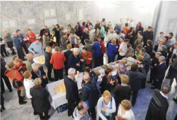
Pogostitev v Sokolskem domu v organizaciji in izvedbi prostovoljk DU