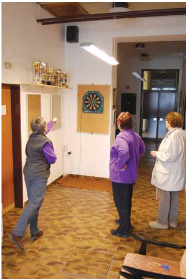
Trening v športnem delu galerije Hodnik